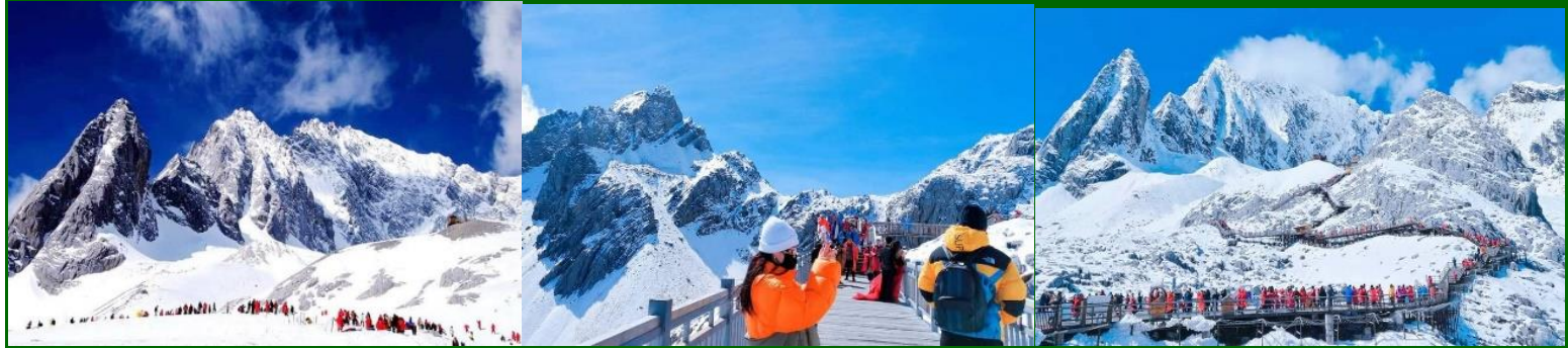
วันที่ห้า ลี่เจียง เทียวเมืองแห่งตำนานของนักเดินทาง